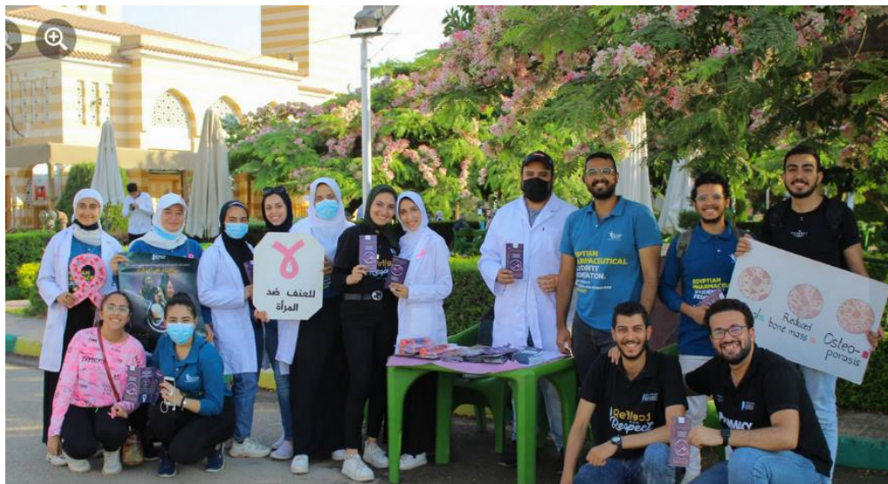
Women Campaign- Club Awareness

https://www.facebook.com/media/set/?set=a.3126972850907253&type=3