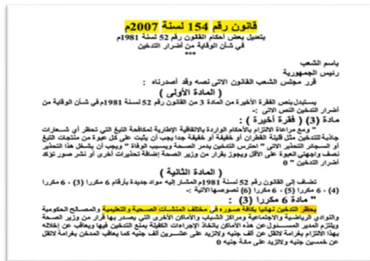
Fig1. Egyptian Parliament-issued anti-smoking law issued since 2007.