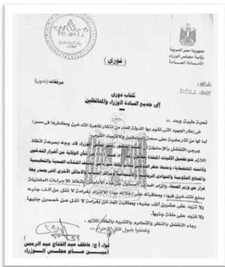
Fig2. directives issued by the Ministry of Health on 28th October 2021 to prevent smoking inside universities.

MUST's no-smoking policy was issued by its vice dean for environment & community affairs and initiated in 2021, is not only a reflection of our commitment to promoting a healthy and safe environment but also a strict adherence to both Egyptian law and international guidelines. We take pride in being fully compliant with the United Nations Framework on Tobacco Control, to which Egypt belongs. In addition, our commitment to ensuring a smoke-free campus is in strict accordance with the directives issued by the Ministry of Health on 28 th October 2021 (fig1,2,4,5). For an example of these policies enforcement, you can check library rules .