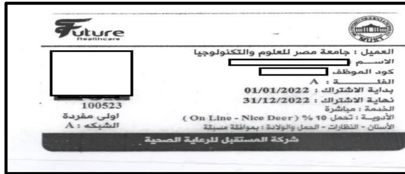
Medical insurance card for the academic and nonacademic staff.

The university has established a protocol with an insurance company, ensuring that all university members have access to affordable healthcare services nationwide. Moreover, Misr University of Science and Technology's Hospital “Dr. Souad Kafaf Hospital” offers special discounts to both university employees and their families, reaffirming our dedication to support our staff living wage by reducing their expenses .